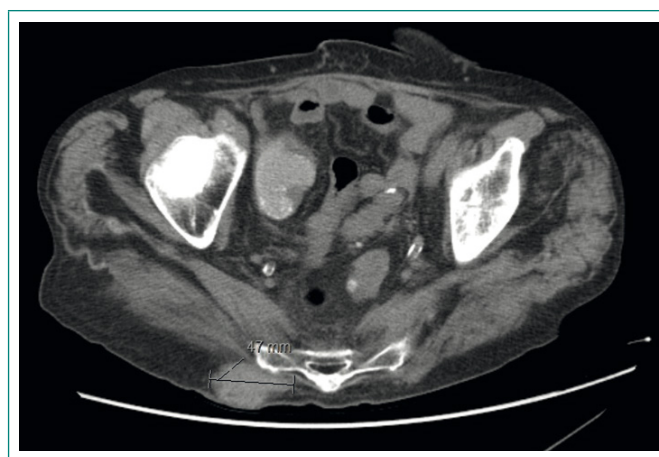
Figura 2. Metástasis de partes blandas en región glútea derecha